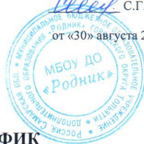
ГРАФИК работы административного, учебно-воспитательного и технического состава МБОУ ДО «Родник» С 01 сентября 2021 года